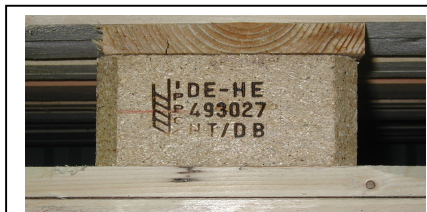
Abb. 1: IPPC-Symbol auf dem mittleren Palettenfuß einer neuen Europoolpalette

Die Palettenkufen und Klötze müssen unbeschädigt sein.