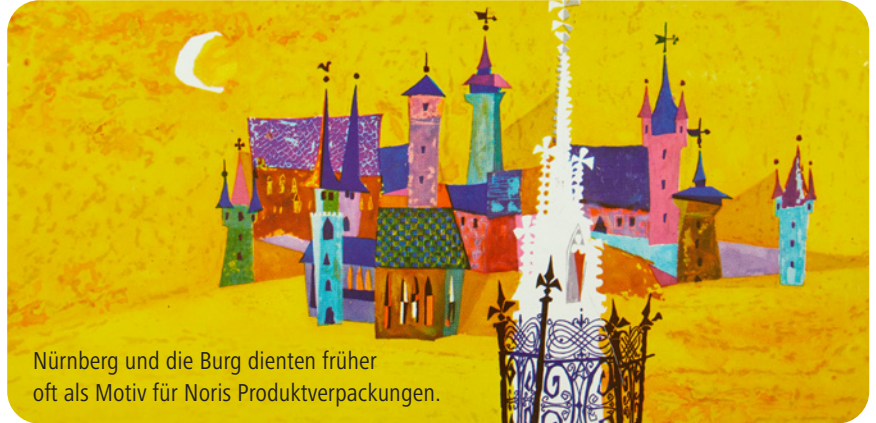
Nürnberg und die Burg dienten früher oft als Motiv für Noris Produktverpackungen.

Die Marke Noris feiert 2021 ihren 120. Geburtstag. Sie wurde am 10. September 1901 offiziell beim Kaiserlichen Patentamt eingetragen.