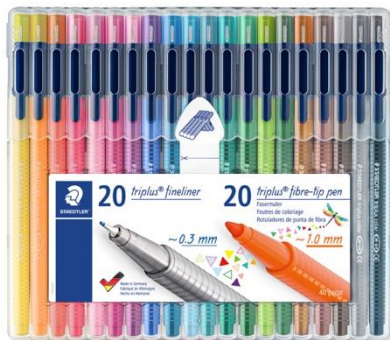
Die STAEDTLER Box gibt es nun auch mit 40 Stiften